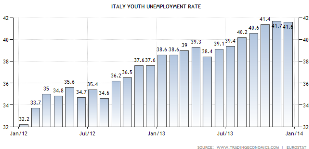
Grafico dell'andamento della disoccupazione giovanile nel biennio 2012-2013

Tratto dal sito internet di Repubblica – sezione Economia e finanza, 12 settembre 2015