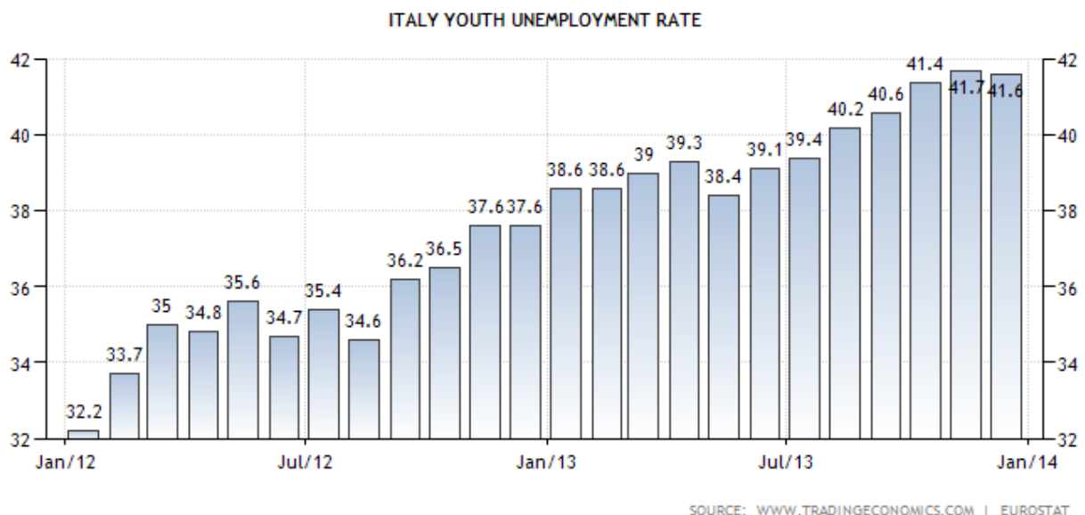
Grafico dell'andamento della disoccupazione giovanile nel biennio 2012-2013

Tratto dal sito internet di Repubblica – sezione Economia e finanza, 12 settembre 2015