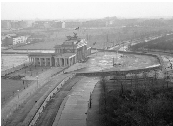
Le mur près de la porte de Brandebourg, 1962

Entre 1945 et 1961, plus de 3,6 millions d'Allemands de l'Est (RDA) émigrent en Allemagne de l'Ouest (RFA), attirés par un meilleur niveau de vie. Enfin, le 12 août 1961, fut prise la décision officielle du conseil des ministres de la RDA concernant les mesures visant à fermer la frontière entre les secteurs oriental et occidentaux de Berlin.